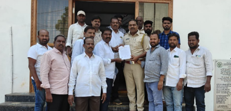
2వ వార్డులో బెల్ట్ షాపులు బంద్ చేసిన సేవం