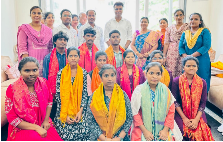
మట్టిలో మాణిక్యాలు... ఘనమైన ఫలితాలు..

కళాశాల ప్రారంభమైన మొదటి విద్యా సంవత్సరం నుంచే లైఫ్ సైన్స్ కోర్సులతో పాటు ఉపాధిని కల్పించే కోర్సులను విద్యార్థులకు అందజేస్తూ కళాశాల మంచి పేరు గడిచింది. వృత్తి విద్యా కోర్సుల్లో భాగంగా బైసిసి, ఎంపీసీ, సీఈసీ, హెచ్ఐసీ కోర్సులతోపాటు మల్టీపర్పస్ హెల్త్ పర్సనల్ (ఎంపిహెచ్ఐ), మెడికల్ ల్యాబ్ టెక్నిషియన్ (ఎం.ఎల్.టి), కంపెనీ సెక్యూరిటీ (సీఎస్), ఎలక్ట్రికల్ టెక్నిషియన్ (ఈటి), ఫార్మా టెక్నాలజీ వంటి కోర్సులను అందిస్తుండటంతో విద్యార్థుల ప్రవేశాలు ఘననీయంగా పెరిగాయి. గత విద్యా సంవత్సరంలో ప్రవేశపెట్టిన ఫార్మా టెక్నాలజీ కోర్సులోనూ 98% విద్యార్థులు ఉత్తమ ఫలితాలు సాధించి ప్రభుత్వ కళాశాలల కూడా ప్రైవేట్ కళాశాలలకు ఏ మాత్రం తీసుకోవటా నిరూపించారు.