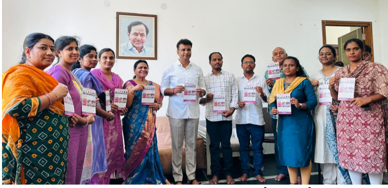
ప్రభుత్వ కళాశాలలకు దిక్సూచిగా కె.ఎం.పాండు మెమోరియల్ గవర్నమెంట్ వోకేషనల్ జూనియర్ కాలేజ్.

కుత్బుల్లాపూర్ నీలగిరి వార్త ప్రతినిధి టి. రమేష్ :