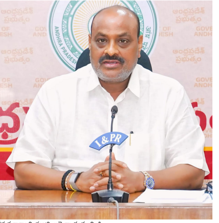
తీసుకురావాలని మంత్రి అచ్చెన్నాయుడు విజ్ఞప్తి చేశారు.

చేసినా ప్రభుత్వం రైతుల వజ్రానే నిలుస్తుంది. అధికారులు లేకుండా అబద్ధాలు సృష్టించి వాట్సాప్ గ్రూపుల్లో, సోషల్ మీడియాలో వైరల్ చేస్తే సహించేది లేదు. అలాంటి వారిని గుర్తించి చట్టపరంగా కఠిన చర్యలు తీసుకుంటాం. అవసరమైతే క్రిమినల్ కేసులు కూడా నమోదు చేస్తాం అని మంత్రి హెచ్చరించారు. గత ఏడాది మామిడి రైతులు ఇబ్బందులు ఎదుర్కొన్న సమయంలో ముఖ్యమంత్రి చంద్రబాబు నాయకత్వంలోని కూటమి ప్రభుత్వం వెంటనే స్పందించి రైతులను ఆదుకుందని గుర్తు చేశారు. రైతులకు నష్టం జరగకుండా తీసుకున్న చర్యల వల్ల వేలాది మంది రైతులకు ఊరట లభించిందన్నారు. ఈ ఏడాది కూడా మామిడి రైతులకు ఎలాంటి ఇబ్బందులు తలెత్తకుండా ప్రభుత్వం ప్రత్యేక దృష్టి సారించిందని తెలిపారు. రైతులకు గిట్టబాటు ధర లభించేలా, కొనుగోళ్ల ప్రక్రియ సజావుగా సాగేలా, పరిశ్రమలతో సమన్వయం ఉండేలా అధికారులకు ఇప్పటికే స్పష్టమైన ఆదేశాలు ఇచ్చామని చెప్పారు. రైతుల పేరుతో రాజకీయాల చేసే వైసీపీ నేతలు, సోషల్ మీడియా మూలాల అసత్య ప్రచారాలు మానుకోవాలని హితవు పలికారు. రైతుల సంక్షేమంపై ప్రభుత్వానికి పూర్తి నిబద్ధత ఉందని, వారి ప్రయోజనాలను కాపాడటంలో ఎలాంటి రాజీ ఉండదని స్పష్టం చేశారు. మామిడి రైతులు ఎవరూ తప్పుడు ప్రచారాలను నమ్మవద్దని, ఏ సమస్య ఉన్నా ప్రభుత్వం దృష్టికి