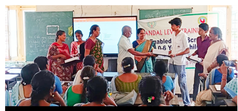
మండలంలో పదో తరగతి ఫలితాల్లో అందజేశారు. ఈ కార్యక్రమంలో అభ్యుత్తమ మార్కులు సాధించి, ఉత్తమ స్థానాల్లో నిలిచిన విద్యార్థులను మండల పరిధిలోని పలు అంగన్వాడీ కేంద్రాల తీవ్రత కార్యకర్తలు పాల్గొన్నారు.

ఎదుగుదల లోపాలను తొలిదశలోనే గుర్తించే విధానాలపై తీవ్రతకు అవగాహన కల్పించారు. లోపాలు ఉన్నట్లు గుర్తించిన 0 నుండి 6 నెలల లోపు చిన్నారులను స్థానిక ప్రభుత్వ వైద్యుల వద్దకు తీసుకెళ్లి, పరీక్షలు చేయించి వారి సూచనలను పాటించాలని ఆమె స్పష్టం చేశారు. తాళ్లపూడి, మలకపల్లి సెక్టార్ల పరిధిలోని అంగన్వాడీ తీవ్రతకు మలకపల్లి ప్రభుత్వ వైద్యుల ద్వారా అనుపూర్ణ ప్రత్యేక అవగాహన కల్పించారు. చిన్న పిల్లల్లో గమనించాల్సిన ముఖ్యమైన ఆరోగ్య, శారీరక మార్పులు, లోపాలను ఎలా గుర్తించాలనే అంశాలపై ఆమె దిశానిర్దేశం చేశారు. తాళ్లపూడి