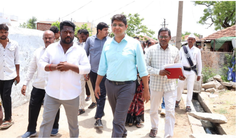
కామారెడ్డి జిల్లా ప్రతినిధి: నీలగిరి వార్త: