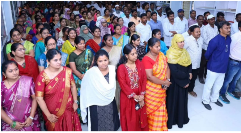
మార్చి 9 నీలగిరి వార్త: