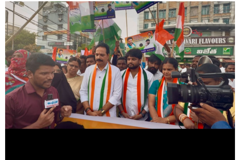
పురోగమిస్తోందని ఈ సందర్భంగా నాయకులు పేర్కొన్నారు. ఈ మహా అభివృద్ధి సభ, ర్యాలీలో కాంగ్రెస్ పార్టీ సీనియర్ నాయకులు, మహిళా కాంగ్రెస్ కలిసిన ఈ కార్యక్రమం శేరిలింగంపల్లి నాయకులు, యాత్ కాంగ్రెస్ ప్రతినిధులు, ఎన్ ఎస్ యు ఐ నాయకులు, ప్రజాప్రతినిధులు, అభిమానులు, కార్యకర్తలు భారీ సంఖ్యలో పాల్గొని

అభివృద్ధి సందేశాలతో కూడిన ప్రకారాలు ప్రదర్శిస్తూ ప్రత్యేక ఆకర్షణగా నిలిచారు. ఈ సందర్భంగా శేరిలింగంపల్లి నియోజకవర్గ భవిష్యత్ అభివృద్ధికి దిశానిర్దేశం చేసే సుమారు రూ.2,000 కోట్లకు పైగా విలువైన పలు ప్రతిష్టాత్మక అభివృద్ధి కార్యక్రమాలకు శంకుస్థాపన జరగడం చారిత్రాత్మక ఘట్టంగా నిలిచింది. ప్రధానంగా మయూపూర్ షైవర్, లింగంపల్లి రైల్వే ఓవర్ బ్రిడ్జ్ (ఆర్.ఓ.బ్రి), గచ్చిబౌలి ఐ ఐ టి జంక్షన్ షైవర్, భాజాగూడ జంక్షన్ షైవర్, యంగ్ ఇండియా ఇంటిగ్రేటెడ్ స్కూల్స్, కోర్ అర్బన్ స్కూల్స్ వంటి కీలక ప్రాజెక్టులు శేరిలింగంపల్లి అభివృద్ధికి కొత్త ఊపునిచ్చేలా రూపుదిద్దుకోనున్నాయి. ఈ ప్రాజెక్టులు ప్రజల జీవన ప్రమాణాలను మెరుగుపరచడంతో పాటు ఆధునిక మౌలిక సదుపాయాల విస్తరణకు దోహదపడనున్నాయి. ప్రజా సంక్షేమం, నాణ్యమైన విద్య, ఆధునిక మౌలిక సదుపాయాల అభివృద్ధి లక్ష్యంగా తెలంగాణ ప్రభుత్వం ముఖ్యమంత్రి రేవంత్ రెడ్డి దూరదృష్టి నాయకత్వంలో ముందుకు సాగుతుండగా, శేరిలింగంపల్లి నియోజకవర్గం అభివృద్ధి పథంలో వేగంగా