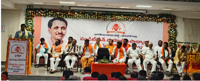
మధ్యప్రదేశ్ రాష్ట్ర ఇంచార్జ్