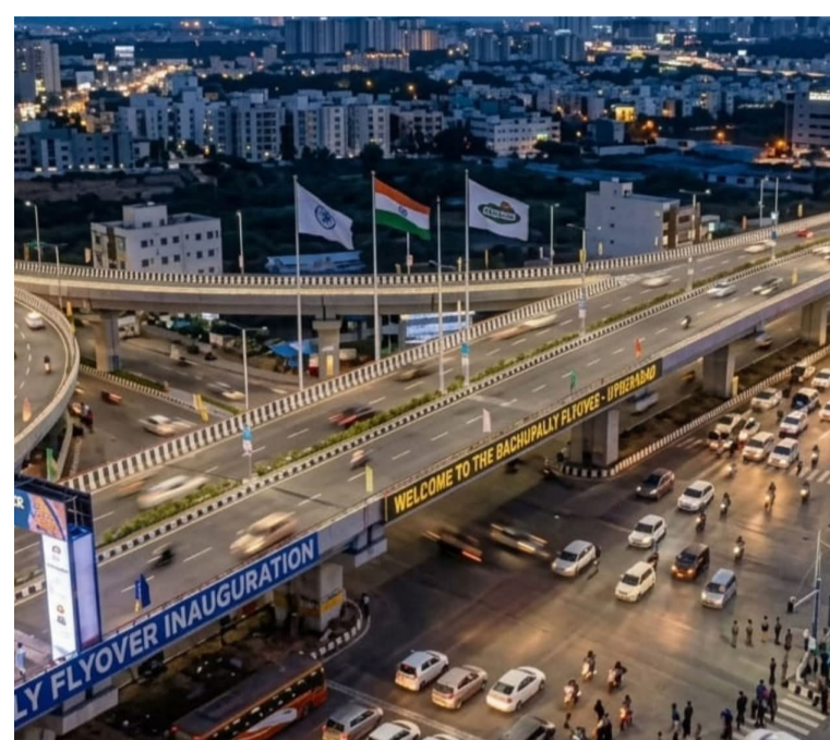
అదనపు మౌలిక సదుపాయాల ప్రాజెక్టులకు కూడా శంకుస్థాపన చేస్తారు.

కీలక వివరాలు మార్గం ప్రయోజనాలు మియాపూర్ సిగ్గులే సమీపంలో జరిగిన బహిరంగ సభలో ప్రసంగిస్తూ ముఖ్యమంత్రి రేవంత్ రెడ్డి షేడవర్ను అధికారికంగా ప్రారంభిస్తారు. నిరాటంకమైన అనుసంధానంతో ఈ ప్రాజెక్ట్ మియాపూర్, నిజాంపేట్, మల్లంపేట్, బోపరంపేట్ మరియు గాంధీమైసన్ము వైపు ట్రాఫిక్ ప్రవాహాన్ని మెరుగుపరచడం ద్వారా వేగంగా అభివృద్ధి చెందుతున్న వాయవ్య హైదరాబాద్ కారిడార్ కు గొప్ప ఉపశమనాన్ని అందిస్తుంది. ఈ ప్రాజెక్ట్ లో 1.3 కిలోమీటర్ల షేడవర్ డెక్తో పాటు, ప్రాంతీయ నెట్వర్క్ను బలోపేతం చేయడానికి ఎగ్జిట్ 4ూ ర్యాంపులు మరియు బహుపల్లి--మల్లంపేట్ రోడ్డు అభివృద్ధి కూడా ఉన్నాయి. ప్రారంభోత్సవ కార్యక్రమంలో ముఖ్యమంత్రి, మియాపూర్ షేడవర్, బహుపల్లి--మియాపూర్ క్రాస్రోడ్స్ అండర్పాస్, మరియు ఆల్టిస్ క్రాస్ రోడ్స్--హాఫీజ్పేట్ అండర్పాస్లతో సహా ఈ ప్రాంతంలోని