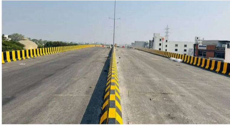
నేడు ప్రారంభించునున్న ముఖ్యమంత్రి రేవంత్ రెడ్డి మియాపూర్ గండిమైసన్ము వాసులకు గుడి న్యూస్..

ప్రారంభానికి రెడీగా భారీ షేడవర్, ఇక ఆ రూట్లో ట్రాఫిక్ జామ్ కు చెక్!