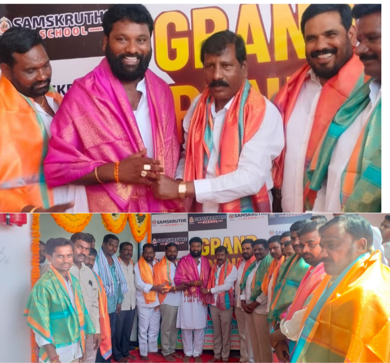
హయత్ నగర్ లో ఘనంగా రిబ్బన్ కట్టిన శ్రీ స్కూల్ ప్రారంభం