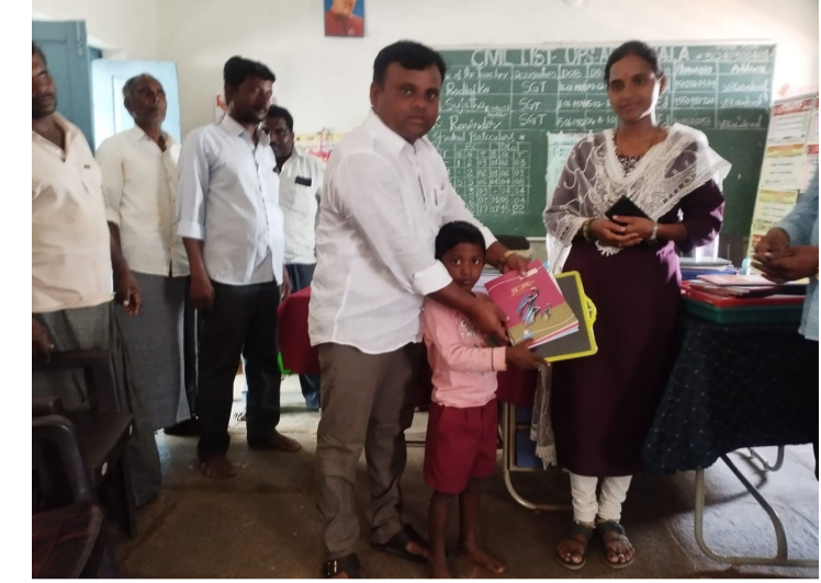
విద్యార్థులకు మంచి నీలగిరి వార్త వికారాబాద్ జిల్లా ప్రతినిధి