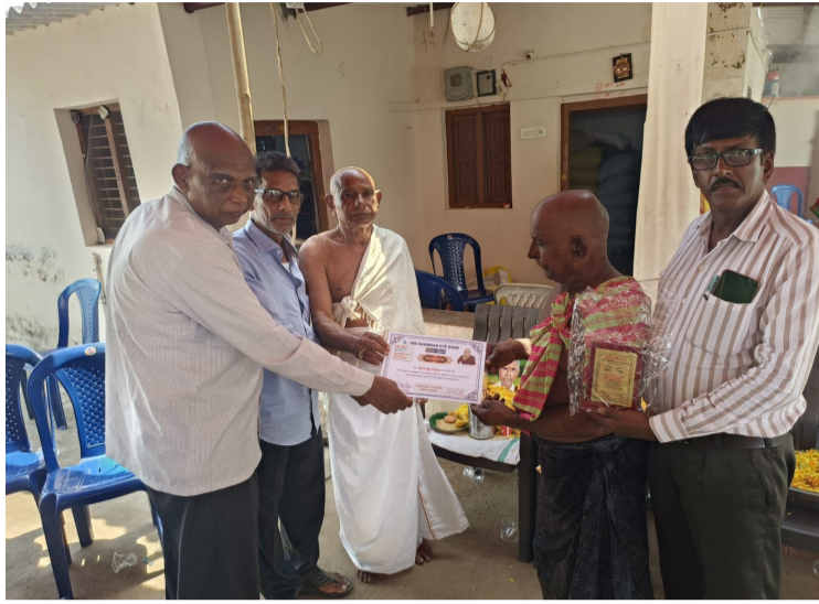
విప్లవోద్ధమానికి ఆమె చేసిన సేవలు మరువలేనివి

కవి రచయిత ఎన్ తిర్తల్ టీజీఎస్ రాష్ట్ర ప్రధాన కార్యదర్శి గోపగాని