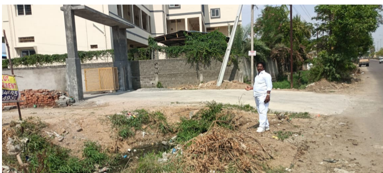
ఇప్పటికైనా అధికారులు స్పందించి వరద నీరు, రోజువారీ వాడుకనే నీరు ఉరుసు బైపాస్ రోడ్డు నుండి ఉరుసు గట్ట వెళ్ళు మోరీ ద్వారా వెళ్లేలా ఏర్పాటు చేయాలని యోగానంద్ కోరారు.