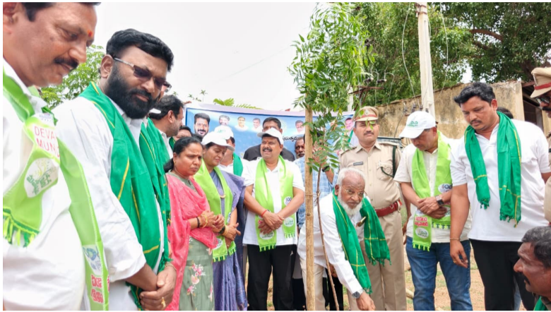
దేవరకొండ నీలగిరి వార్త