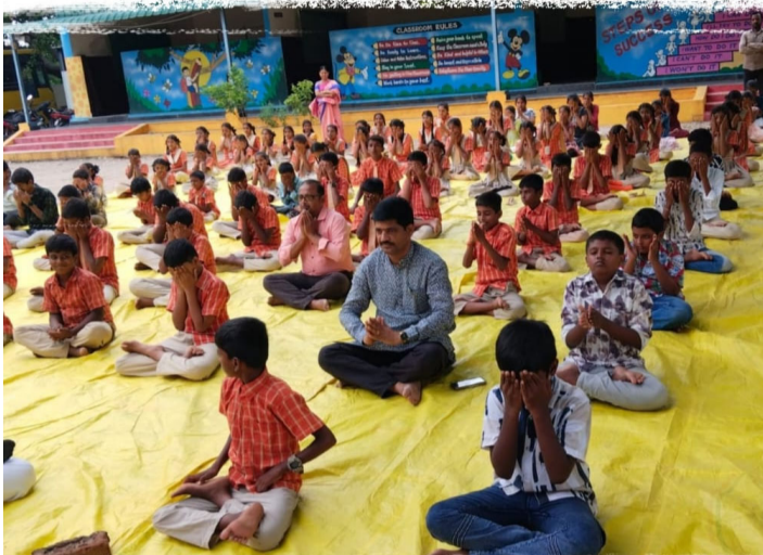
నాపల్లి నీలగిరి వార్త జూన్ 20