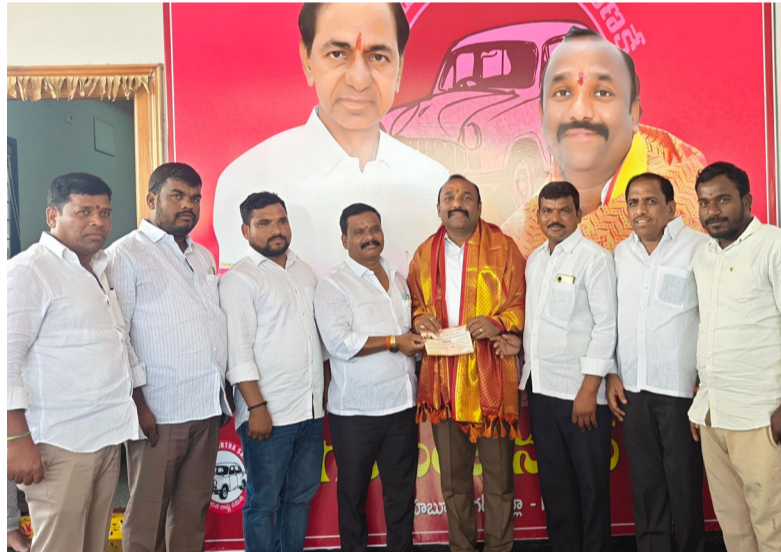
నీలగిరి వార్త ప్రతినిధి ఫోటో నగర్