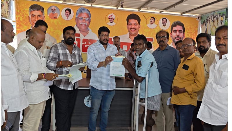
జగ్గంపేట నీలగిరి వార్త కాకినాడ జిల్లా, జగ్గంపేట జూన్ 14:

జగ్గంపేట రావులమ్మ నగర్లోని ఎమ్మెల్యే క్యాంప్ ఆఫీసులో ముఖ్యమంత్రి సహాయనిధి చెక్కుల పంపిణీ జోరుగా సాగింది. నియోజకవర్గంలోని నాలుగు మండలాలకు చెందిన 22 మంది లబ్ధిదారులకు రూ.6,90,766 విలువైన సీఎంఆర్ఎఫ్ చెక్కులను కాకినాడ జిల్లా డీపీఐ అధ్యక్షులు, నియోజకవర్గ అభివృద్ధి