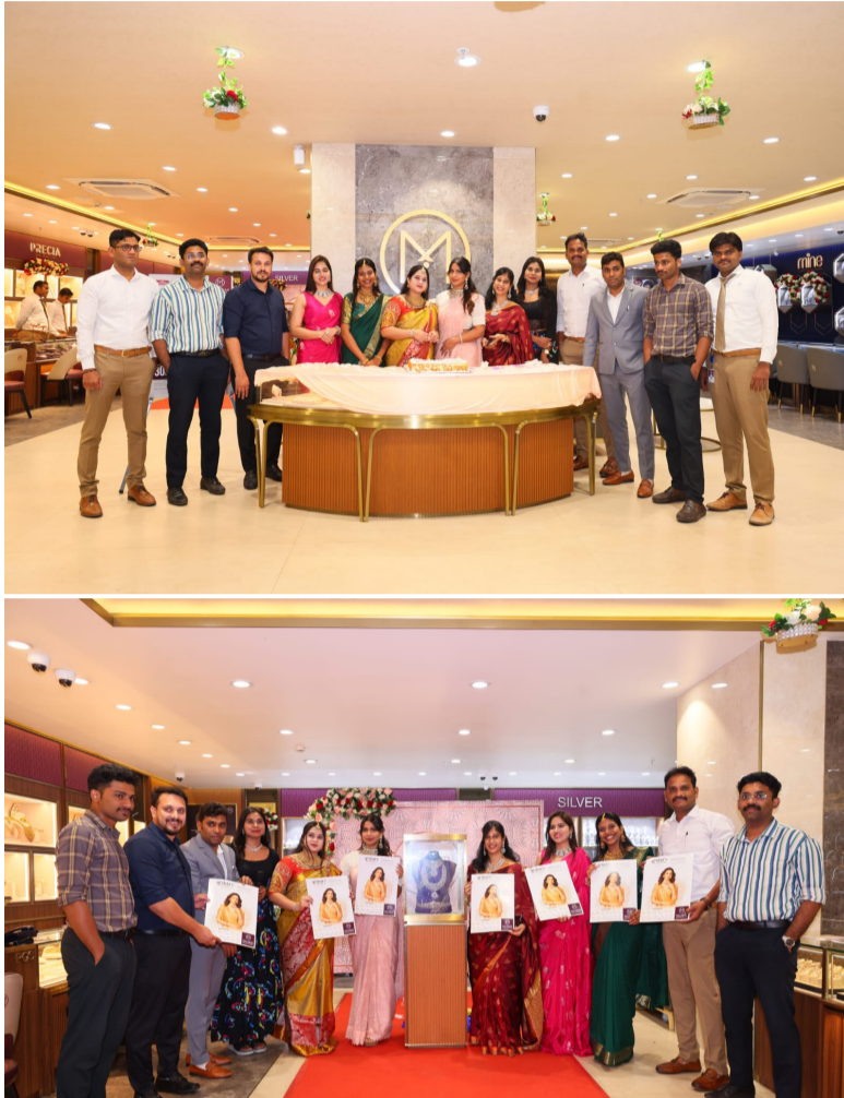
షోరూములు 14 హోల్ సేల్ యూనిట్లు, కార్యాలయాలు డిజైన్ కేంద్రాలు ఫ్యాక్షన్లతో భారతదేశం ఆస్ట్రేలియా కంపెనీ మలబార్ గోల్డ్ డ్రైమండ్స్ భారతదేశంలోని కేరళ రాష్ట్రంలో 1993 సంవత్సరంలో స్థాపించబడిన మలబార్ గోల్డ్ డ్రైమండ్స్. నేడు 445కి పైగా రిటైలర్లలో 6వ స్థానంలో నిలిచింది డెలాయిట్ యొక్క గ్లోబల్ పవర్ 500 లగ్జరీ గూడ్స్ 2023 ర్యాంకింగ్లో 19వ స్థానం కైవసం చేసుకుంది.

ప్రత్యేక ఆభరణం, అన్ని బంగారు, అన్నట్ రత్నాభరణాల తరుగు చార్జీలపై 30 పర్సెంట్ వరకు తగ్గింపు పొందండి. వజ్రాభరణాల వజ్రాల విలువ పై 30 పర్సెంట్ వరకు తగ్గింపు పొందండి మలబార్ గోల్డ్ డ్రైమండ్స్ నిబద్ధతలో భాగంగా, తమ మినియో గదారులకు 12 న్యాయమైన వాగ్దానాలను అందిస్తుంది. ఖచ్చితమైన తయారీ ధర రాక్ష బరువు, నికర బరువు. ఆభరణాల రాక్ష విలువతో కూడిన పారదర్శక ధరల పట్టి. ఆభరణాలకు జీవితకాల ఉచిత నిర్వహణ. పాత బంగారు ఆభరణాలను తిరిగి విక్రయించేటప్పుడు బంగారానికి 100 శాతం విలువ మరియు బంగారం మార్పిడిపై శూన్య తగ్గింపు, వజ్రాభరణాల మార్పిడి పై 100 శాతం విలువ, నూరు శాతం బి.ఐ.ఎస్ హాల్ మార్కెట్ ధృవీకరించబడిన స్వచ్ఛమైన హాయిడ్ బంగారం, అంతర్జాతీయ ప్రమాణాలకు అనుగుణంగా 28-పాయింట్ల నాణ్యత పరీక్షలు నిర్వహించిన బజిబి జిబి ధృవీకరించిన వజ్రాభరణాలు, బైబ్యాక్ గ్యారెంటీ, నాణ్యతను తనిఖీ చేయడానికి క్యూరెట్ ఎనలైజర్, జీవితకాల నిర్వహణ మరియు బాధ్యతాయుతమైన మూల్యం నుండి బంగారు సేకరణ వంటి అందిస్తుంది. మలబార్ గోల్డ్ డ్రైమండ్స్ గురించి విభిన్న వ్యాపార సమ్మేళనాలతో స్థాపించబడిన ప్రముఖ భారతీయ వ్యాపార సంస్థ మలబార్ గ్రూపు యొక్క ఫ్లాగ్ షిప్ కంపెనీ మలబార్ గోల్డ్ డ్రైమండ్స్ భారతదేశంలోని కేరళ రాష్ట్రంలో 1993 సంవత్సరంలో స్థాపించబడిన మలబార్ గోల్డ్ డ్రైమండ్స్. నేడు 445కి పైగా