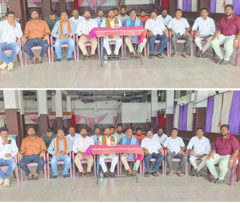
రాజన్నను దర్శించుకునే భాగ్యాన్ని రాజోయే క్రావణ మాసం నుంచే వేములవాడ పట్టణ ప్రజలకు, భక్తులకు కల్పించాలని డిమాండ్ చేశారు. ఒకవేళ క్రావణ మాసంలో దర్శనాలు పునరుద్ధరించకపోతే వేములవాడ ప్రజలందరినీ మమేకం చేసి పెద్ద ఎత్తున ఉద్యమాలు, నిరసనలు చేపడుతామని, అవసరమైతే వేములవాడ బంద్ కు లిలుపునిస్తామని హెచ్చరించారు. అదేవిధంగా భీమన్న గుడిలో స్థానికుల దర్శనాలకు ఎలాంటి ఇబ్బందులు